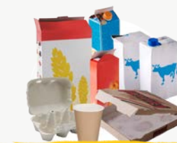
EMBALLAGES CARTONS & BRIQUES ALIMENTAIRES